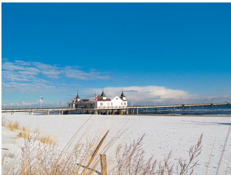
Seebrücke von Ahlbeck