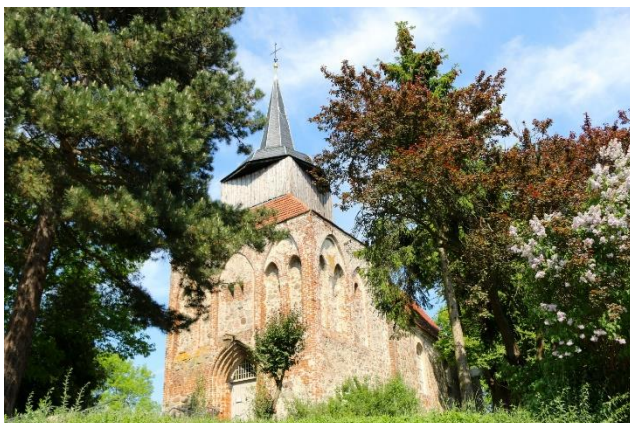
Jakobus-Kirche in Zirchow

Dienstag, 5. Oktober 2021 Mit Papi Leo auf Usedom