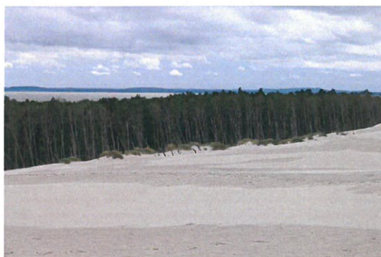
Lontzke Düne, Lebasee