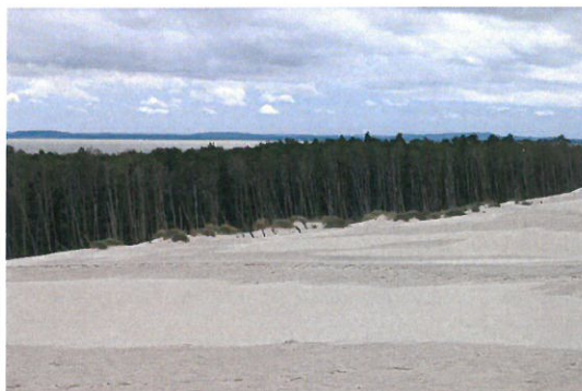
Lontzke Düne, Lebasee