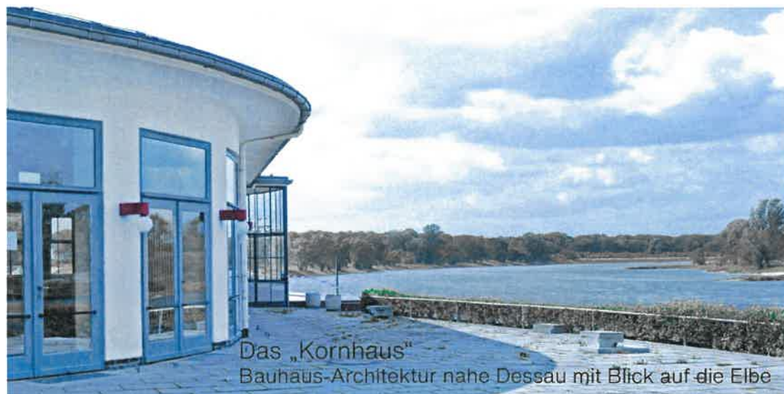
Das „Kornhaus“ Bauhaus-Architektur nahe Dessau mit Blick auf die Elbe