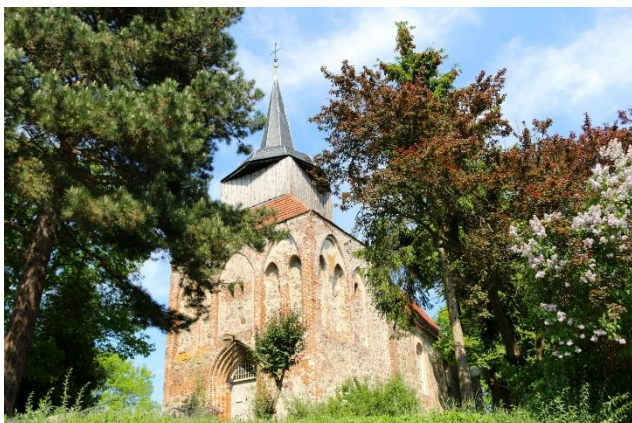
Jakobus-Kirche in Zirchow